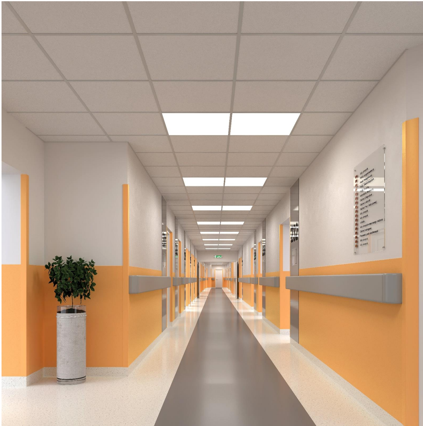
Pomieszczenie P236 Korytarz pow. 49,36 m 2